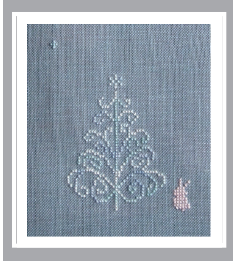
静かな夜のツリー designed by Masako Kodaira